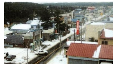
尾駈地区と村役場 1995(平成7年)