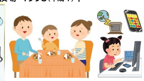
テーブルにイスでの食事 ネット時代へ