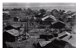
尾駈の集落と村役場 1960(昭和35年)