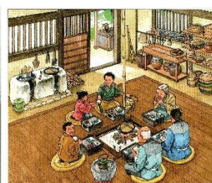
いろりを囲んでの食事