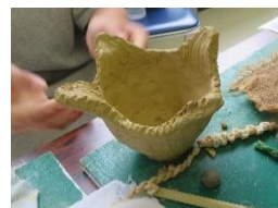
土器づくりの様子