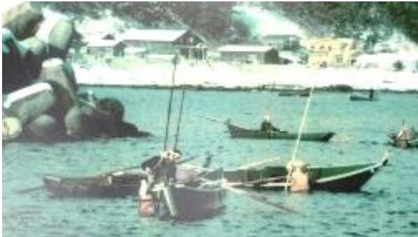
泊:カッコ船によるアワビ漁

尾駁や平沼では、江戸時代から大正時代までニシンを捕るマテ漁が行われ、現在は、高瀬川でマテ小屋(観光用)を見ることができます。