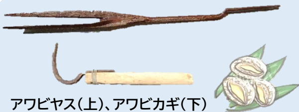
アワビヤス(上)、アワビカギ(下)

11月から2月まで、丸木舟やカッコ船に乗り、箱メガネで海底を見ながら、三本ヤスでアワビを突き、突いたアワビをアワビタモに入れてとっていた。ヤスで突くとアワビに穴があき、値が下がってしまう課題があった。アワビカギは、岩からアワビをひっかけてとる道具。