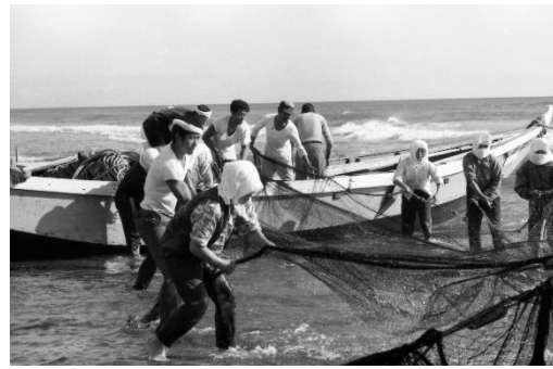
新納屋:地引網漁 昭和48年