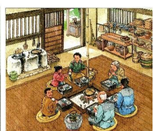
いろりを囲んでの食事