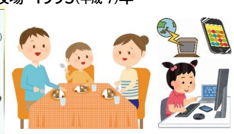
テーブルにイスでの食事 ネット時代へ