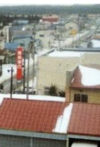
尾駮地区と村役場 1995(平成7年)