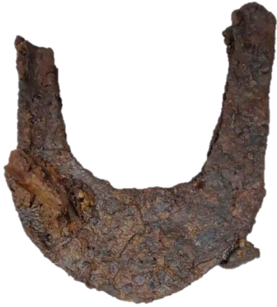
1 てつせいひん かま おきづけいせき せいぎ 鉄製品 鎌 沖附遺跡 10世紀