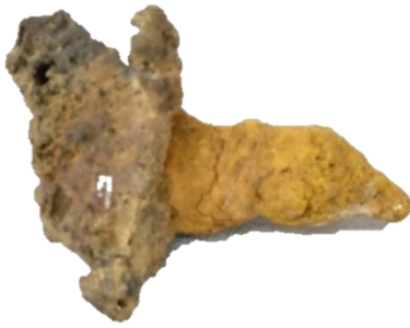
3 てっさい おきづけいせき せいぎ 鉄滓 沖附遺跡 10世紀