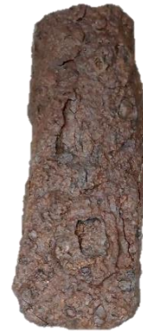
2 てつせいひん ておの おきづけいせきしゆつど せいぎ 鉄製品 手斧 沖附遺跡出土 10世紀