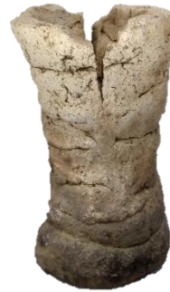
4 しきゃく はつちやざわ いせき せいぎこうはん 支脚 瓮茶沢(1)遺跡 9から10世紀後半