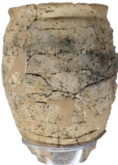
5 はじき はつちやざわ いせき せいぎこうはん 土師器 瓮茶沢(1)遺跡 9から10世紀後半