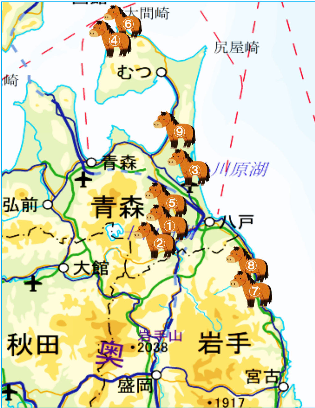
なんぶはんくまき いち 南部藩九牧の位置