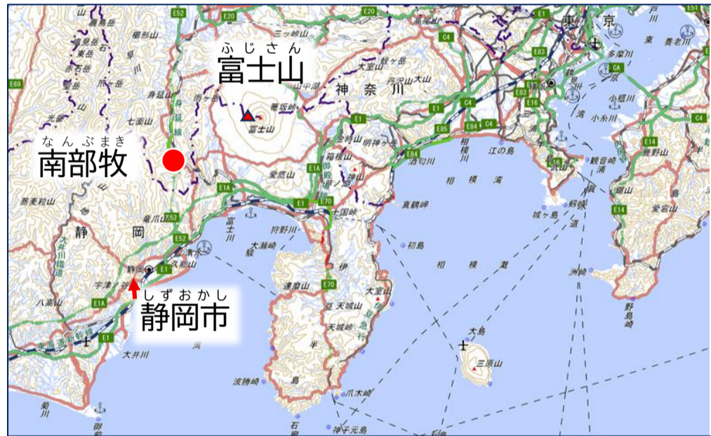
甲斐国南部牧(南部町)の位置