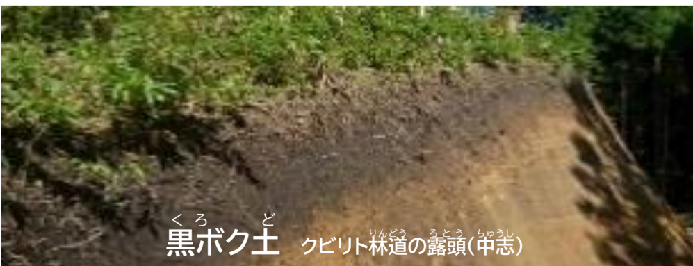
黒ボク土 クビリト林道の露頭(中志)