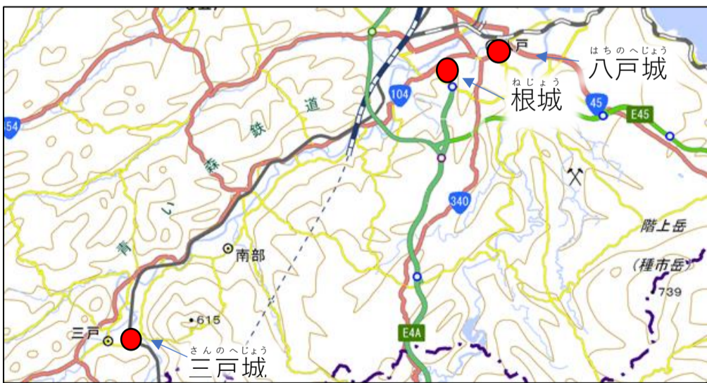
三戸城・根城・八戸城の位置