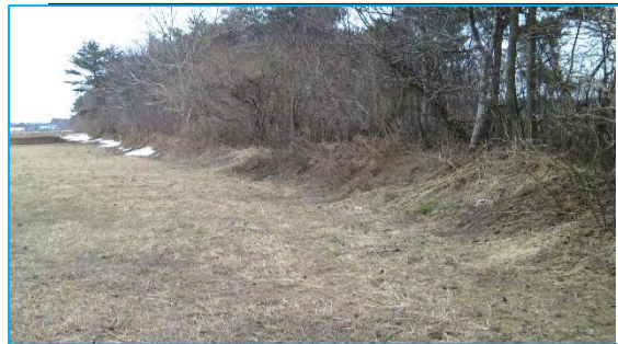
平沼の土手跡 (土壘: 馬よけ土手)

倉内村肝入 孫 八 (印) 平沼村肝入 市右衛門 (印) 鷹架村きも入 平十郎 (印)