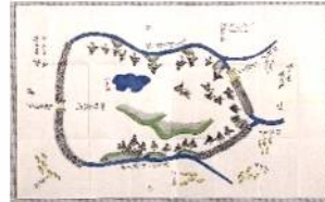
「七戸通蟻渡野ノ図」