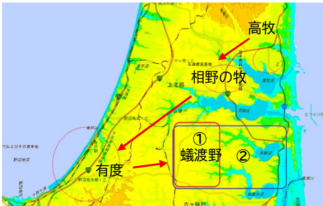
蟻渡野の変遷と想定範囲(絵図の牧は青枠か？)

南部藩九牧「七戸通蟻渡野ノ図」の牧の広さを基にすると赤枠①となるが、絵図内の各村々や水流、沼の位置を基にするとかなり広い青枠②の蟻渡野牧が当てはまる。馬が草を求めて移動するため、青枠の広い範囲と絵図はなつたと考えられる。