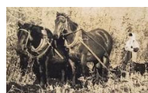
二又地区の馬耕の様子

江戸時代に有戸野の野守木村家に伝わる伝承。「鞍を打っていたから倉内。馬を引くのに泊まったから泊。生れ出たところが出戸。尾がブチの馬がいたので尾駮。鷹待場の架の高さと同じだったので鷹架村。」