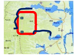
「蟻渡野」の位置