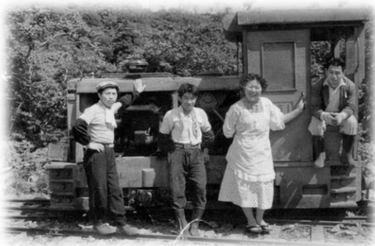
内燃機関車の前で

昭和10年から39年まで、老部川沿いに森林鉄道の機関車が約9kmの区間、天然ヒバ材を運んでいました。軌道跡の林道を自然観察しながら散策します。六ヶ所村の歴史や豊かな自然を体感しましょう！